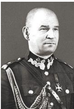
gen. Józef Zajac