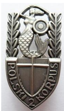
oznaka 2 Korpusu Polskiego