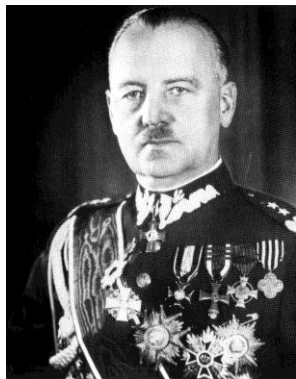
gen. Władysław Sikorski