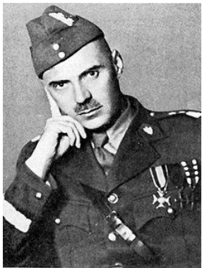
gen. Władysław Anders