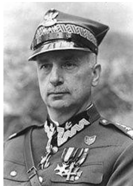
gen. Kazimierz Sosnkowski