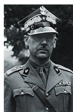
gen. Stanisław Kopański